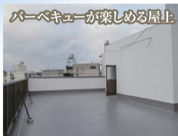
バーベキューが楽しめる屋上