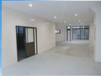
1F 最大3台駐車可能な電動シャッター付ガレージ。