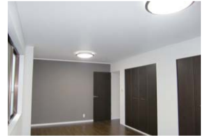
3F 2部屋へ増設可能なカスタマイズフリーの洋室。