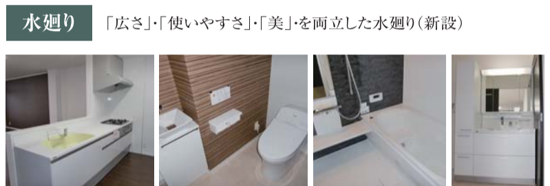
水廻り 「広さ」「使いやすさ」「美」を両立した水廻り(新設)