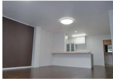
2F ハイクラス住空間。約23.5帖の広々LDK。